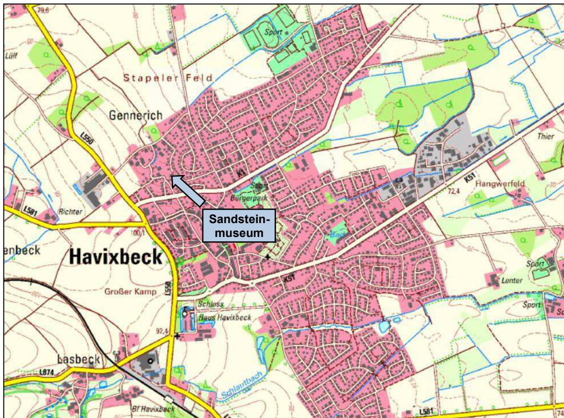
Abb. 1: Übersichtskarte mit Kennzeichnung des Sandsteinmuseums

Das Sandsteinmuseum befindet sich an der Straße Gennerich im Nordwesten von Havixbeck. In Abbildung 1 ist eine Übersichtskarte mit Kennzeichnung der Lage dargestellt; Abbildung 2 zeigt einen Vorabzug des Lageplanes /13/.